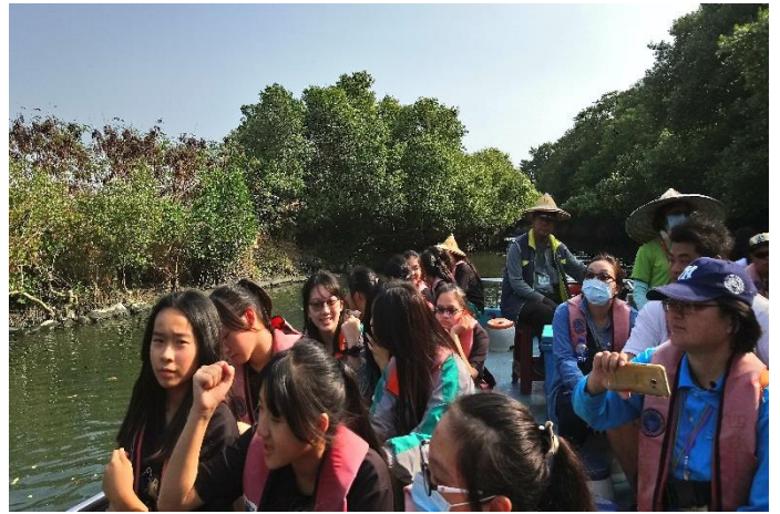
四草綠色隧道~導覽人員解說生態