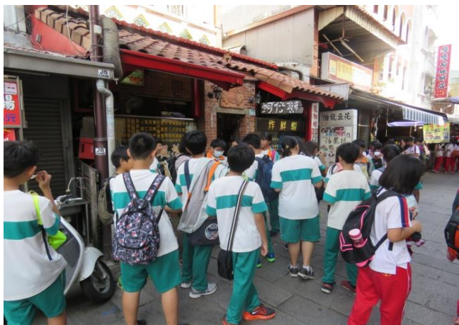
安平老街文化踏查