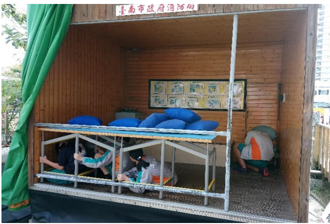
防災教育館~地震體驗屋