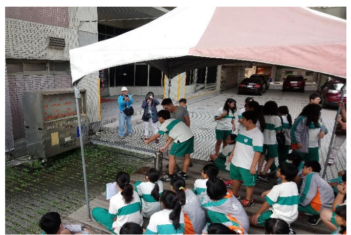
防災教育館~滅火器使用體驗