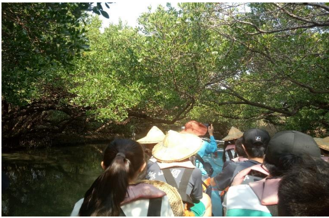
四草綠色隧道~認識兩岸紅樹林