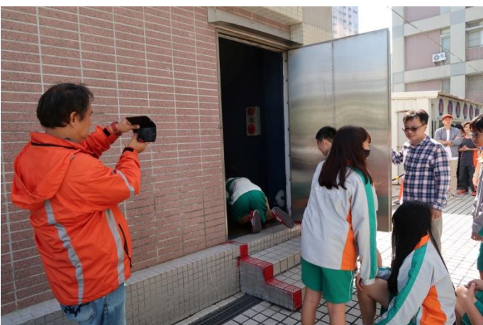
防災教育館~濃煙逃生演練