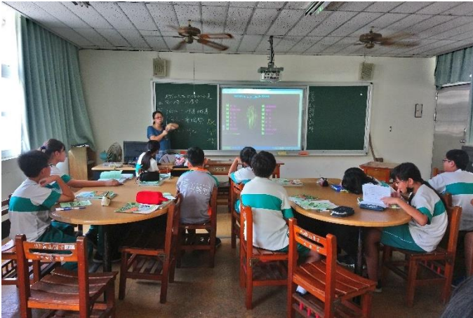
行前紅樹林課程介紹