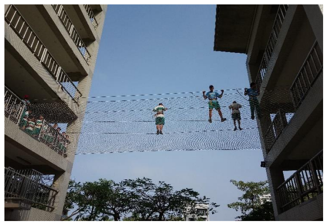
防災教育館~高空逃生演練