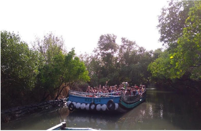
四草綠色隧道~搭乘竹筏