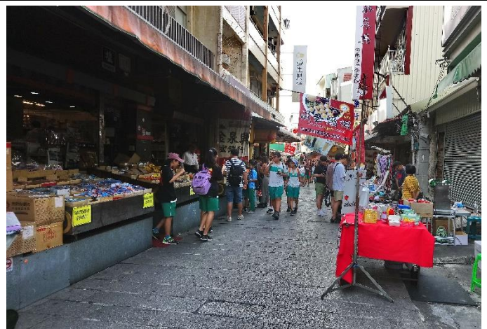
安平老街文化踏查