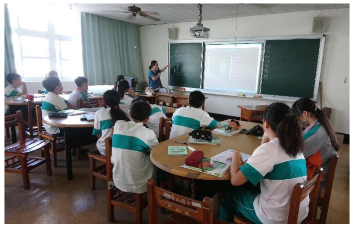
行前紅樹林課程介紹